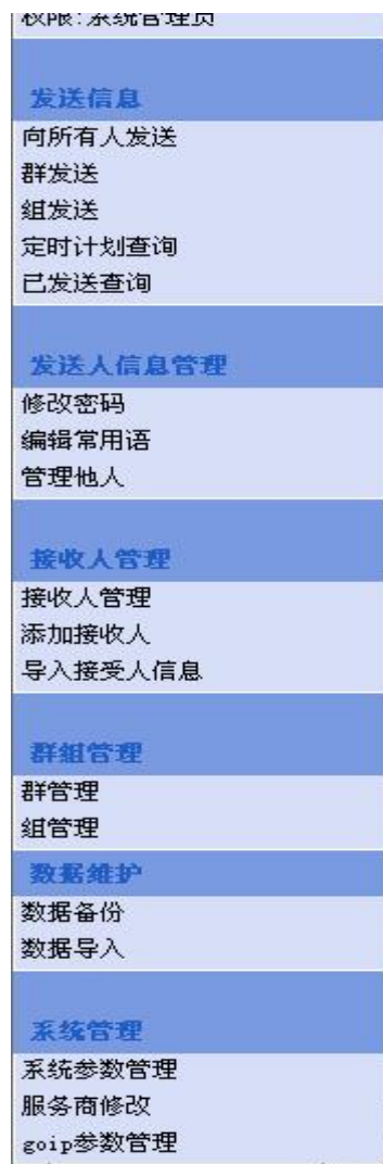
图 软件分为六大功能部分