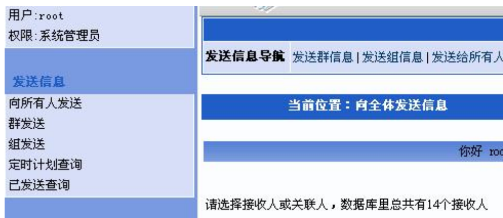
图 三种发送和两种查询